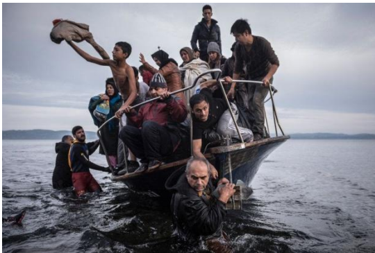
⑤ Arrivée de migrants au large de l'île grecque de Lesbos (2015) 3 Sergey Ponomarev