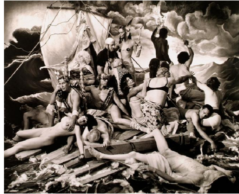
④ Le Radeau du Gouvernement Bush (2006) Joel-Peter Witkin