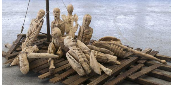
② Le Radeau de la Méduse (sculpture sur bois) Clarisse Griffon du Bellay 2