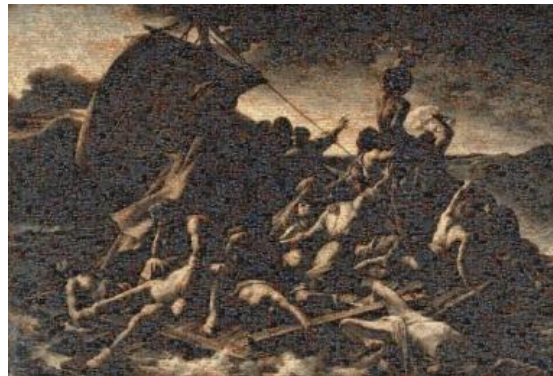
⑥ Harragas, les Damnés de la Mer 4 Kader Attia